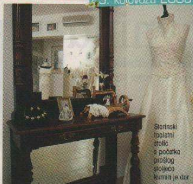
Starinski toaletni stolić s početka prošlog stoljeća kumin je dar