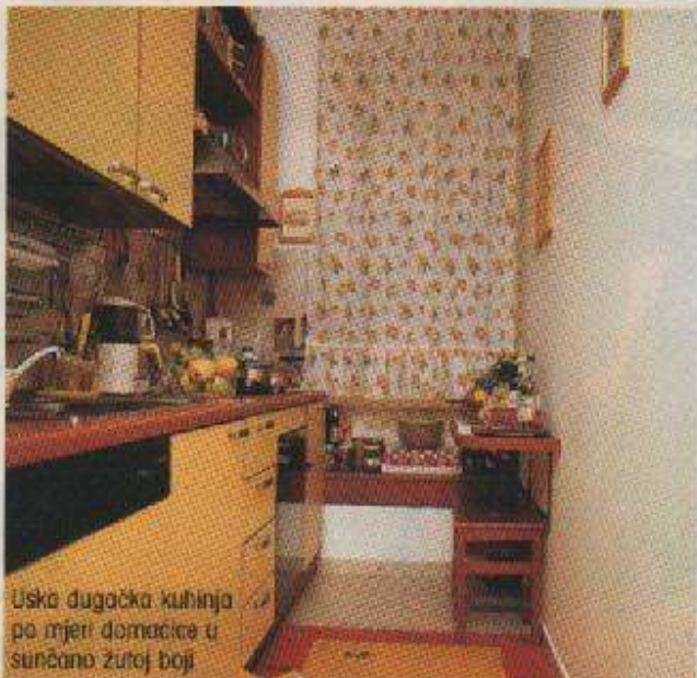
Uska dugačka kuhinja po mjeri domaćice u sunčano žutoj boji