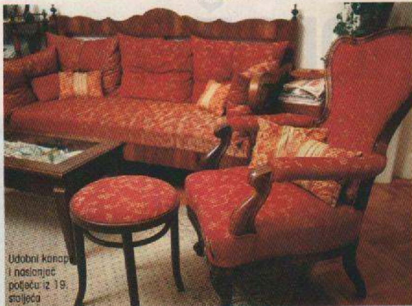
Udobni kanapa i naslonjač pojeću iz 19. stoljeća