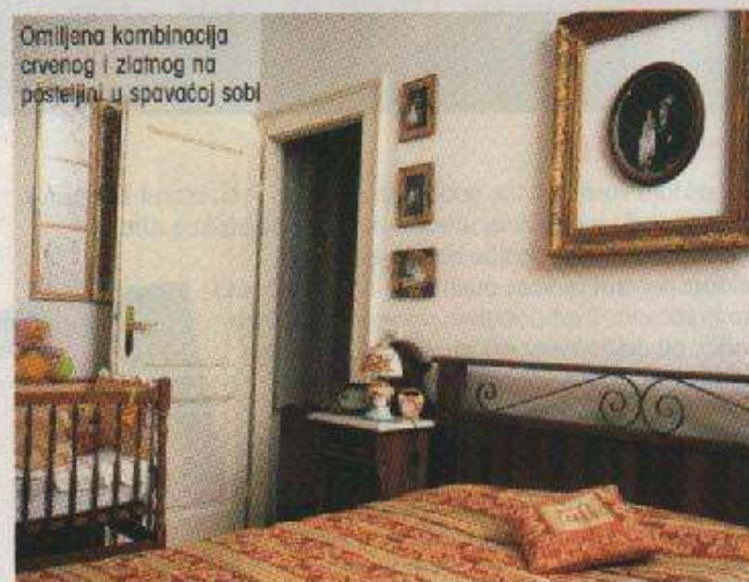
Omiljena kombinacija crvenog i zlatnog na posteljini u spavaćoj sobi